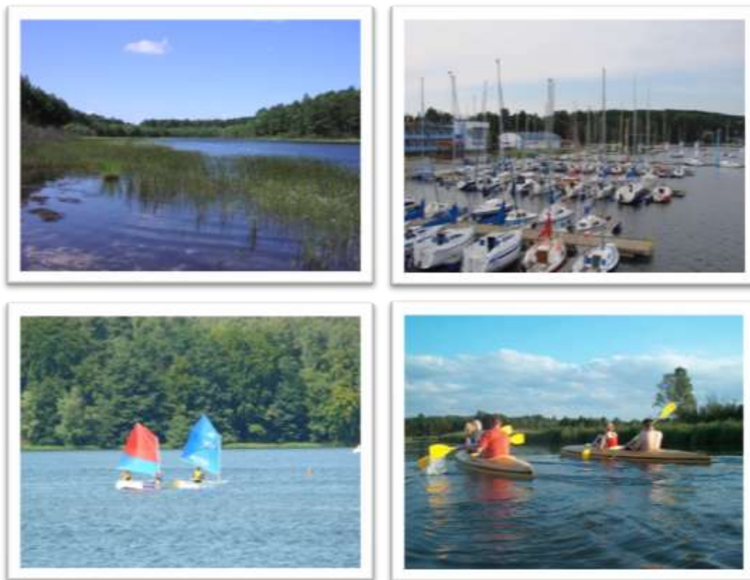
Zdjęcia: atrakcje turystyczne obszaru objętego LSROR

Ważnym elementem infrastruktury turystycznej są szlaki turystyczne zapewniające aktywny i interesujący wypoczynek. Obszar LGR może się poszczycić wielką ich liczbą. Są tutaj wszystkie rodzaje szlaków: piesze, rowerowe, konne, wodne oraz ścieżki dydaktyczne. Szlaki piesze tworzą sieć o długości ponad 400 km.