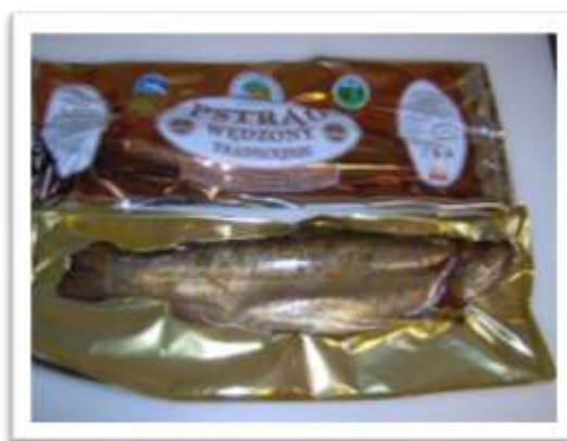
Zdjęcia: uznane w całej Europie pstrągowe przysmaki z Mylofu.