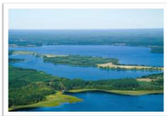
Zdjęcia przedstawiają typowe krajobrazy obszaru objętego LSROR.