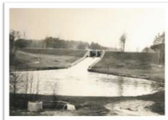
Zdjęcia: po lewej - zabudowa rybacka we Wdzydzach, po prawej - jaz piętrzący na Brdzie, część Zakładu Hodowli Pstrąga w Zaporze – Mylof.