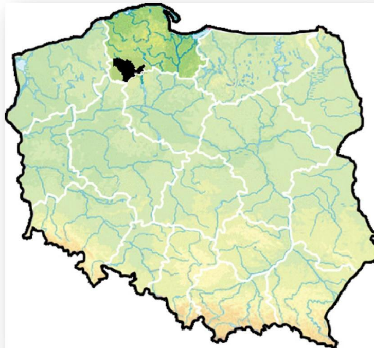
Mapa 1. Lokalizacja LGD na mapie Polski.