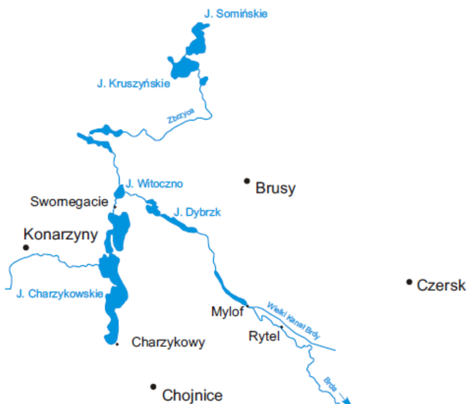
Rysunek 1 Rys. 2. Przebieg rzeki Brdy na obszarze objętym wdrażaniem LSR Źródło: Brdą przez Bory, Zabory i Ziemię Chojnicką, LGD Sandry Brdy, Choj-nice 2010.

W środkowym odcinku Brda płynie początkowo ku wschodowi poprzez ciąg pięknych rynnowych jezior Równiny Charzykowskiej – to początek kompleksu leśnego Borów Tucholskich z Zaborskim Parkiem Krajobrazowym oraz wydzielonym w jego części Parkiem Narodowym Bory Tucholskie. Urozmaicony i kręty bieg rzeki, liczne jeziora i czysta woda są wielkim magnesem przyciągającym turystów, zwłaszcza wodniaków.