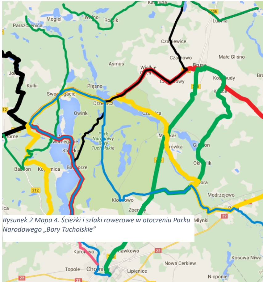
Rysunek 2 Mapa 4. Ścieżki i szlaki rowerowe w otoczeniu Parku Narodowego „Bory Tucholskie”

zagospodarowania oraz nadmierna antropopresja zostały wskazane jako problemy i ograniczenia w rozwoju turystyki kajakowej.